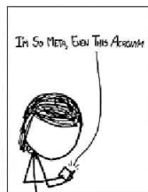
XKCD Komiks Randalla Munroa stává na softwarovém obsahu a jednoduše kresbě.

Američana Randalla Munroa často stává na technologických a vědeckých tématech. Proto byl podle Hildebrandta vhodný právě pro webové stránky vysvětlující principy čísel a internetové měny BitCoin, generované počítačem a nezávislé na státech a centrálních bankách. "Někdo může namítnout, že jerychlejší nakreslit obrázky rukou a naskenovat do počítače. To je pravda, ale zdrojový textový popis s ním umožňuje důležitější jako s dokumentem. Můžete kopírovat, upravovat a porovnávat existující komiks nebo je jednoduše překládat do jiných jazyků," vysvětluje